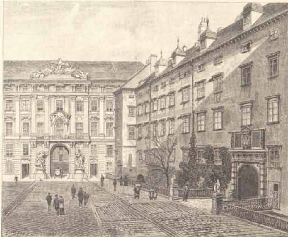
Царски двор у Бечу.

Стеван. Ако би била воља божја, морам се покоравати. Не нијесам рад овога, што ме називаш — превртљивцем, престао подривати основе цркве; но ради тога, што сам увидио да слабост људска, без утицаја духа с више, који увијек ствара, не може сазидати ново здање на земљи, у којем би истинно вје-