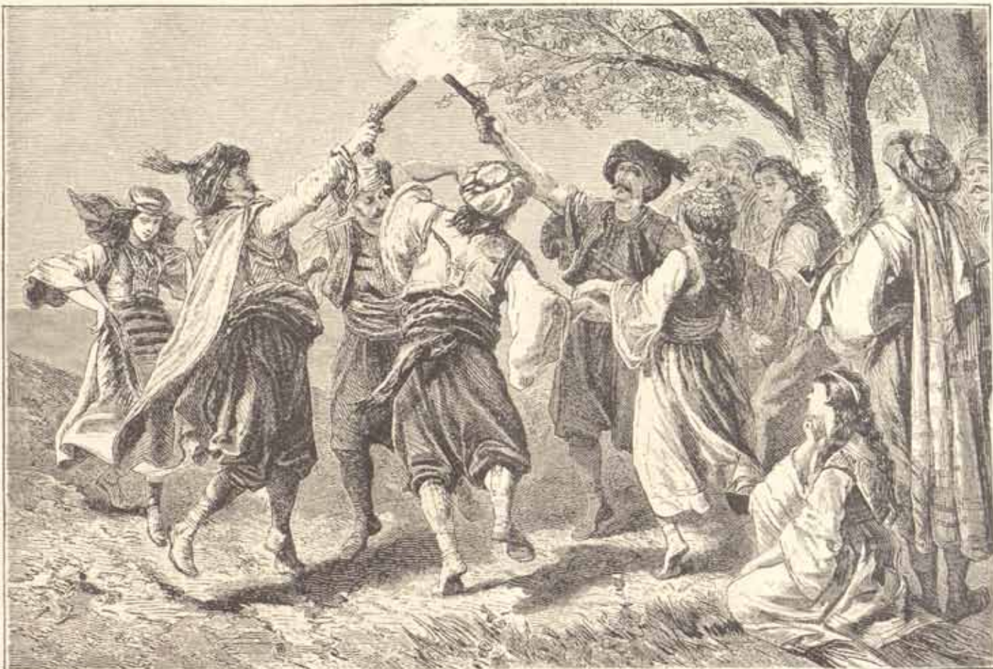
Српско коло у Далмацији.

Хус. Не слави побједу у души! Ништа не можете учинити овијем књигама! Ви немате таквога оружја, да опровргнете истину. Можете је угушити, притијеснити из вријеме, но она ће