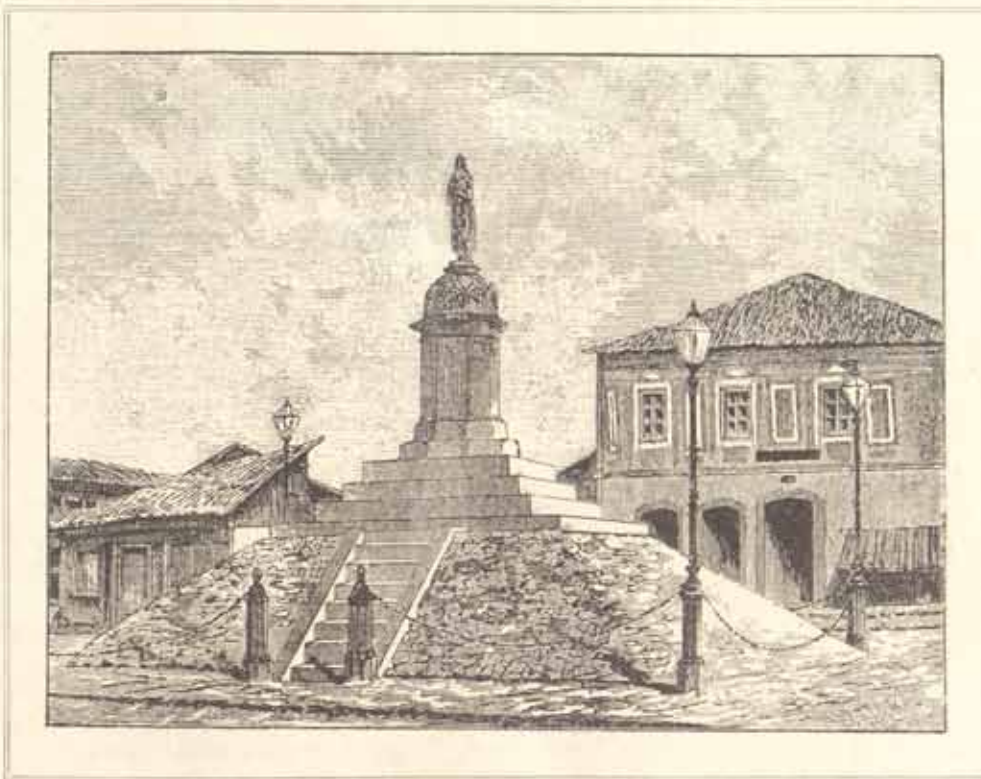
Руски споменик у Плавни.