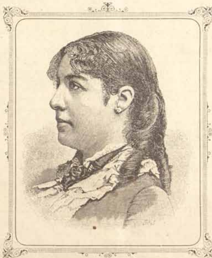
Краљица српска Наталија.

Онај исти јучерањи узде лепо пред мојим очима мој ка-