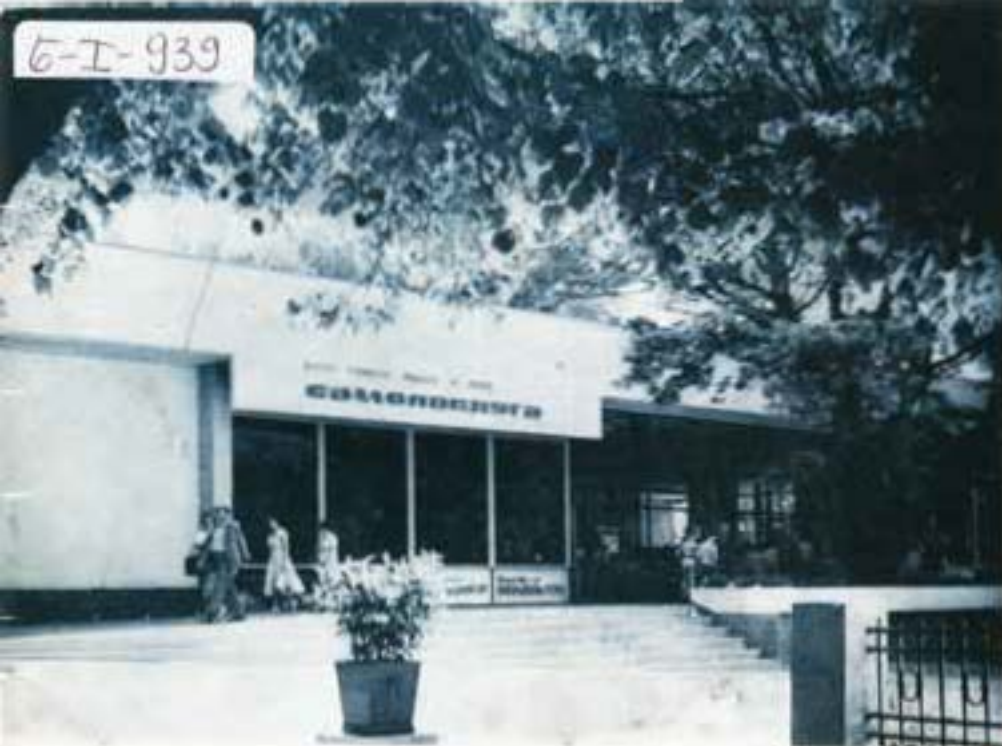
SAMOPOSLUGA „CVETNI TRG“