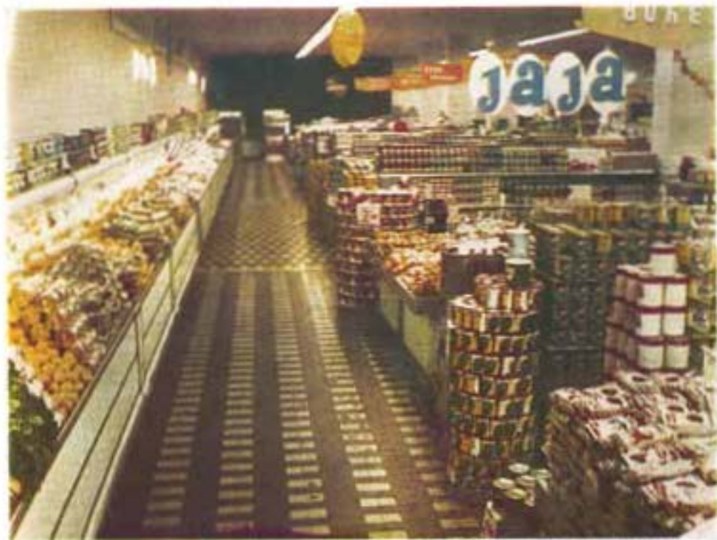
NA OGROMNOM PRODAJNOM PROSTORU U GONDOLAMA I VITRINAMA IZLOŽEN JE IZVANREDNO BOGAT ASORTI MAN ROSE