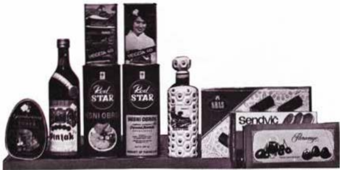
SAMOPOSŁUGA - CVETNI TRG - UVEK JE LANSIRALA NOVE PROIZVOĐE NASE INDUSTRIJE