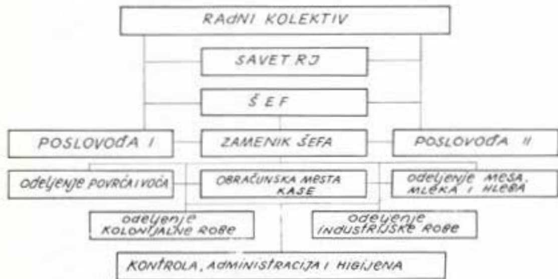
Šema organizacije prodavnice „Cvetni trg“