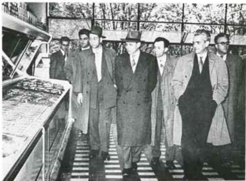
NA DAN OTVARANJA PRVOG SUPERMARKETA U JUGOSLAVIJI — ZVANICE OBILAZE PRODAVNICU