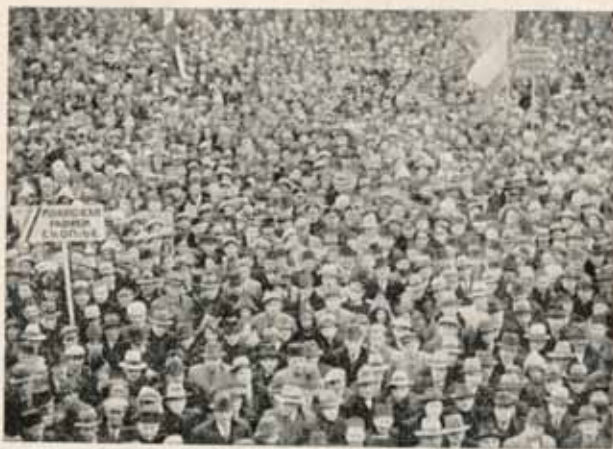
Добро снимљена маса на једном збору.

објекат слике буде од неке нарочите вредности или важности. Напротив, објекат сам по себи може бити сасвим незнатан а да при том буде врло импресивно изражен на слици, што је довољно да задовољи услове насловне стране.