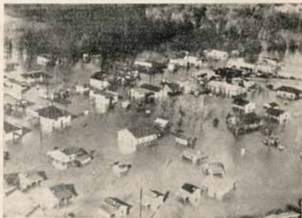
Снимак који јединствено показује обим и величину поплаве у једном месту. Узет је из висице.

Фолклор. — Све оно што се односи на народни живот, обичаје, ношње, итд., а што није било довољно или никако познато, или добро репродуковано.