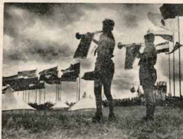
Један сасвим декоративан снимак: облаци, заставе које делују под ветром и перспектива снимка допринели су таквом изгледу.

Да би фотографије стигле редакцији за њен наредни број, дакле на време, треба се претходно упознати са следећим околностима: