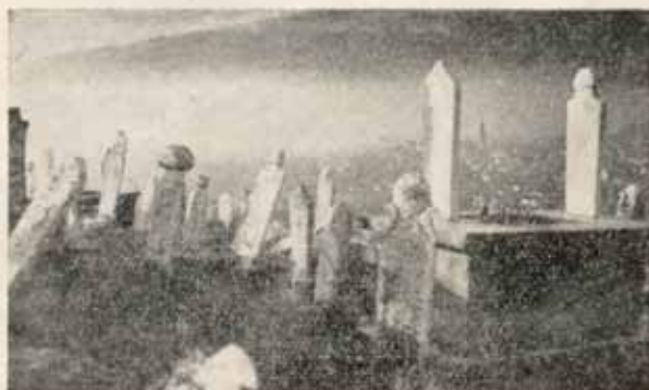
Један изванредан поглед са Гази — Бабе на Скопље.

Разно. — Поклонити пажњу још и многим другим догађајима и призорима, у колико ови могу да занимају поједине листове, као: разним конкурсима лепотица, деце, модним и др., сиромашним људима који доживљују неочекивану велику срећу и богатство (премије, милионска наслеђа) и онима који постижу велике успехе у свима гранама живота, стогодишњаицима и најстаријим људима, занимљивостима и људима природе, људима изузетних особина, новим туристичким призорима и лепотама наше земље, као и многим другим чудним, новим и не свакидашњим сценама и призорима.