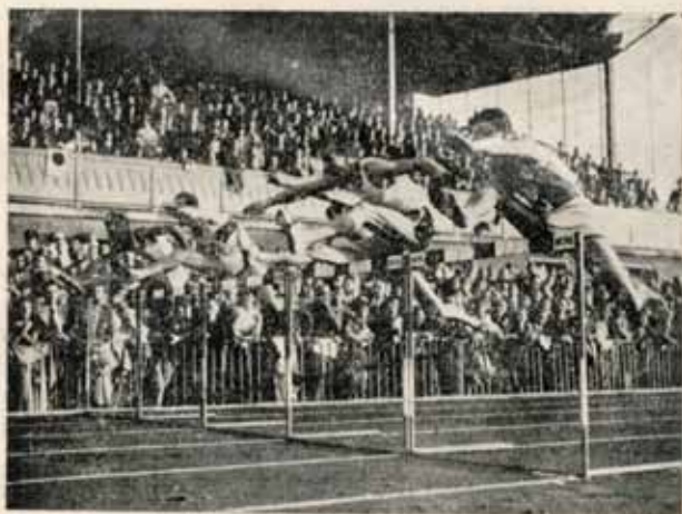
Један леп скок ухваћен у правом моменту када су атлетичари били изнад самих препона.

Нема, може бити, данас једног мало већег места код нас, а да оно није снимљено за поједине дописе или за репродукцију дописних карата. Међутим, многа места не могу се похвалити укуским и