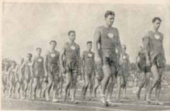
Југословенска лакоатлетска репрезентација дефиљује. Снимак узет одоздо.