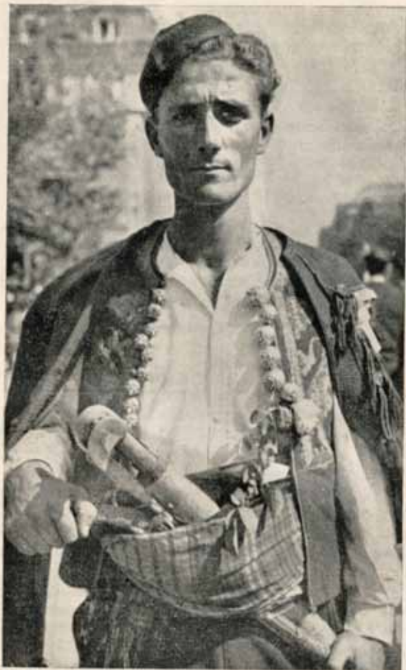
Извесни листови доносе радо наше националне костиме, обичаје, типове и друге моменте из народног живота. Ево једног Далматинца у народној ношњи који и као тип врло добро одговара. (Фото Сусић).