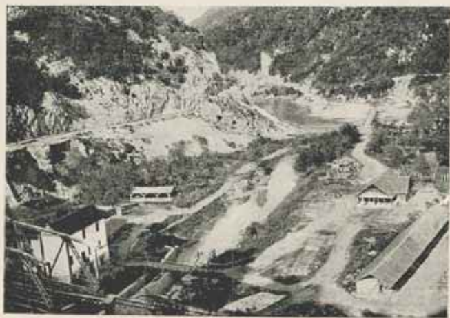
Ovčar banja, Čačak mellett.