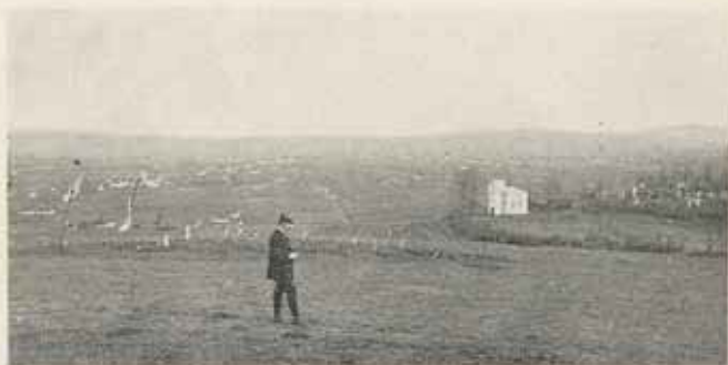
Čačák tájképe egy magaslatról.