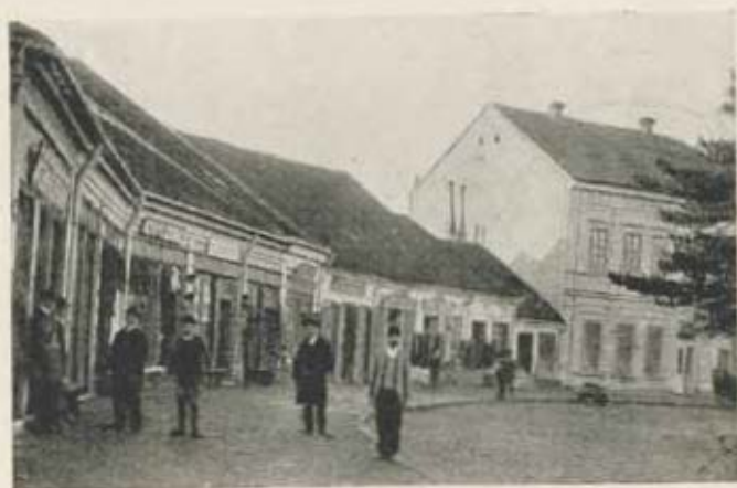
Kraljevo, «Wien» szálloda.