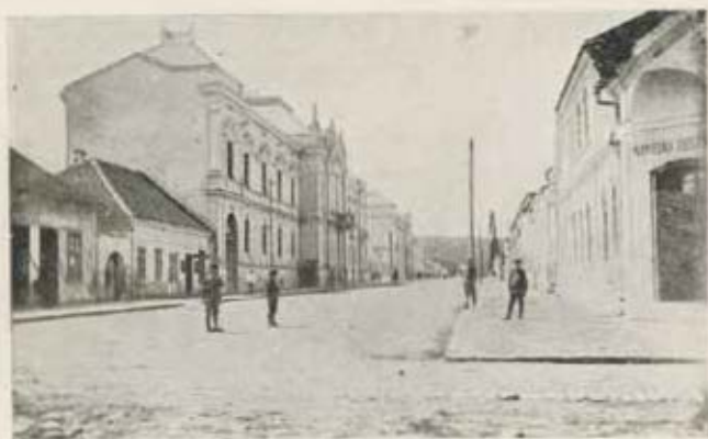
Valjevo, Belgrádi-út, a cs. és kir. kerületi parancsnokság épülete.