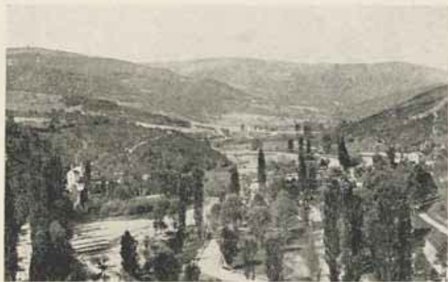
Valjevo vidéke, Pecina.