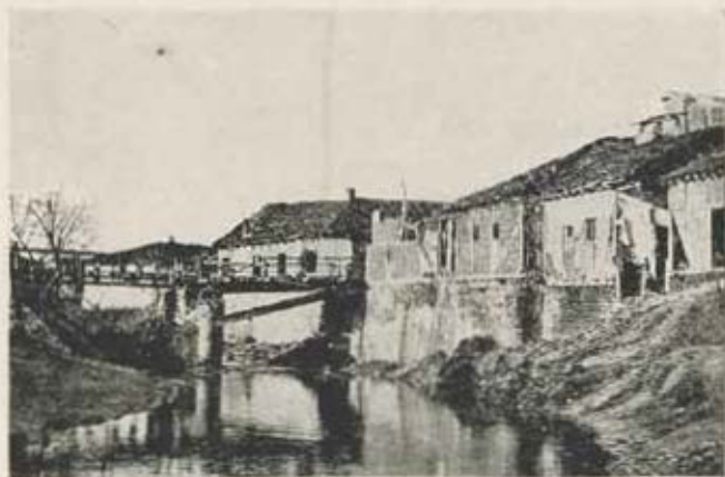
Jagodina, utcai részlet.