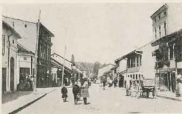
Valjevo, kereskedői negyed.