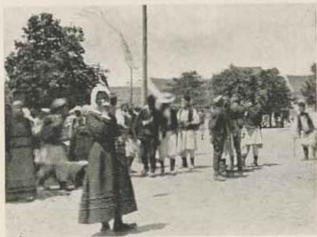
Utcai élet Kraljevóban.