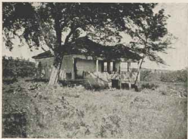
Tanya Jagodina mellett.