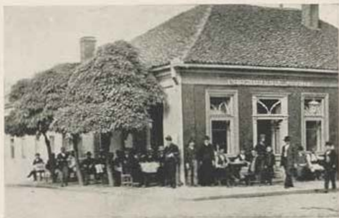
Kraljevo. «Bosna» kávéház.