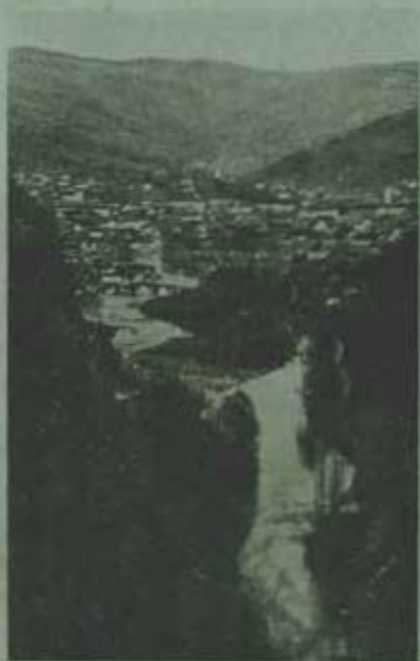
Uziče tájképe a várrom ormáról.