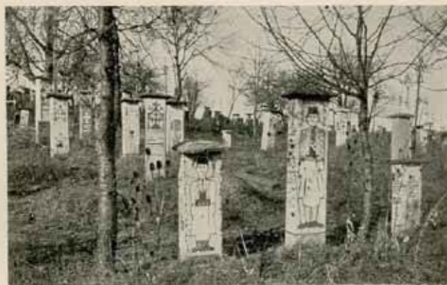
Čačak. Katonai temető.