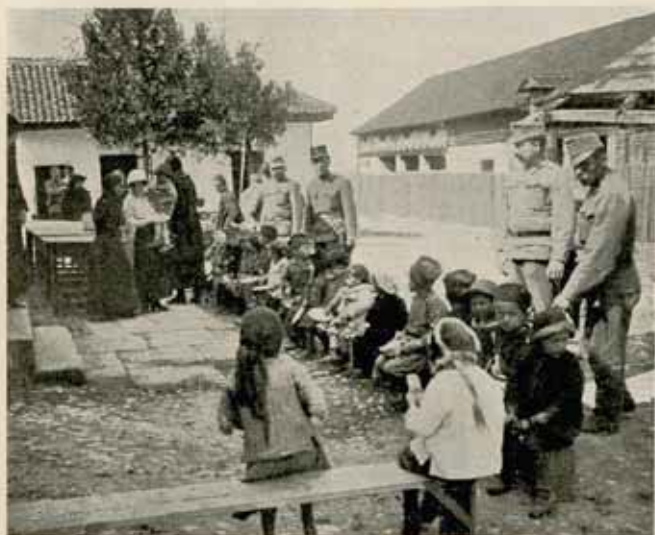
Čačak. Katonaságunk ebédet osztott az árváknak.