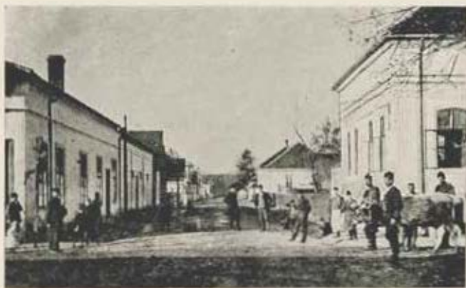
Kraljevo. Vilmos császár-utca.