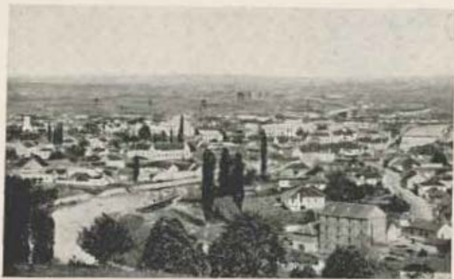
Valjevo észak felől.