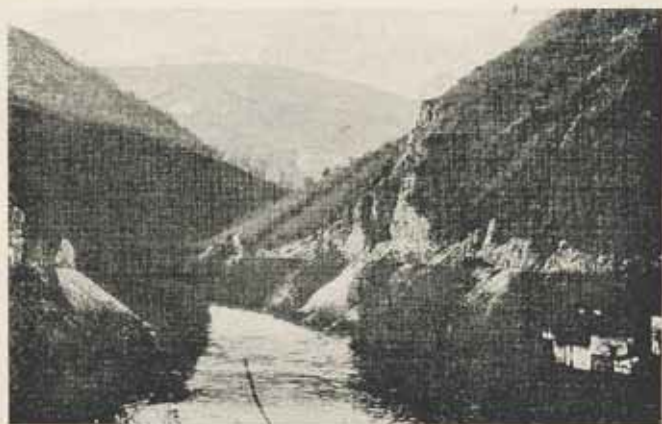
Tájkép Čačak és Požega között.