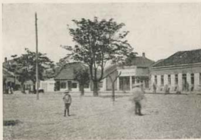
Kraljevo, «Budapest» szálloda.