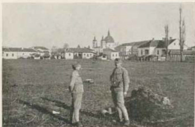
Cačak a templommal.