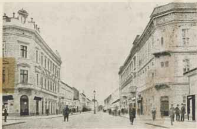
Belgrád, Knyaz Mihajlova-ulica.