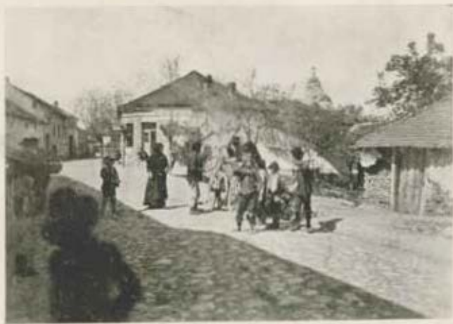
Semendria, utcai részlet.