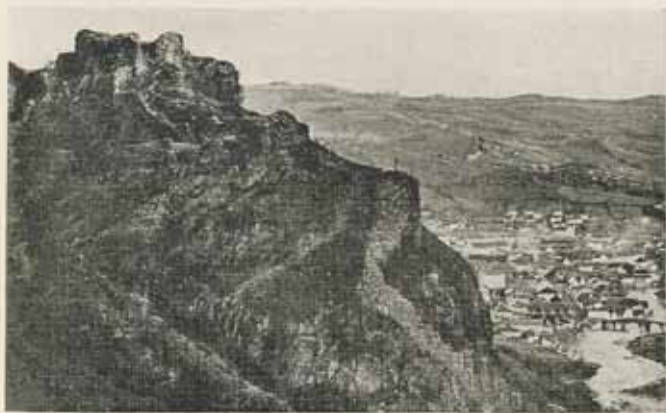
Török várrom Uziče mellett.