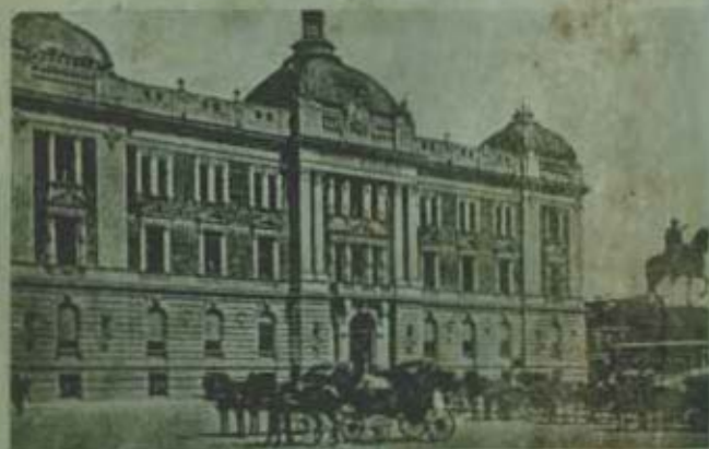
Belgrád, a cs. és k. katonai főkormányzáság székhelye.