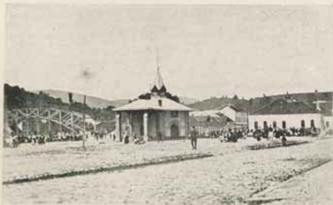
Valjevo, vásártér a Kolubara hídjával.