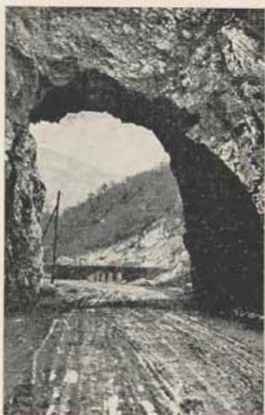
Országút Čačák-Požega között.