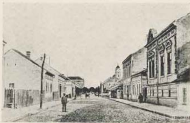
Semendria, utcai részlet.